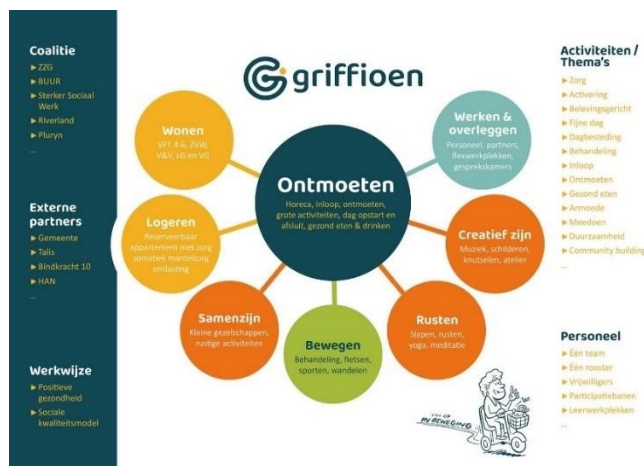
Figuur 1 Coalitie Griffioen

Bij al deze activiteiten staat het ontmoeten centraal om zo verbinding tussen bewoners van Griffioen, de professionals die zijn verbonden aan Griffioen en de wijkbewoners te realiseren. Zie figuur 1. Griffioen doet dit niet alleen, maar met meerdere partijen (zie figuur 1, coalitie).